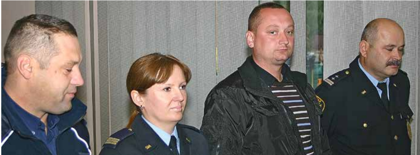
Policjanci z Krościenka i strażnicy miejscy ze Szczawnicy podczas ogłaszania wyroku w sądzie nowotarskim.

PRL bis - metody SB i komunistycznej propagandy w wydaniu szczawnickich włodarzy przy udziale służb mundurowych. W odwecie za publikacje „najechali” na dom dziennikarza.